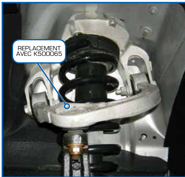
REPLACEMENT AVEC K500065

Quand il faut remplacer la rotule supérieure sur ces véhicules, la pièce d'origine ne peut pas être commandée séparément chez le concessionnaire. Elle n'est disponible qu'en tant que partie d'un ensemble complet de bras de direction en aluminium/ressort amortisseur.