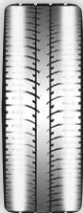
Usure de bords intérieur/extérieur

Un carrossage qui est hors des spécifications va faire que le véhicule tire à gauche ou à droite, et va créer une usure sur le bord intérieur ou extérieur des pneus.