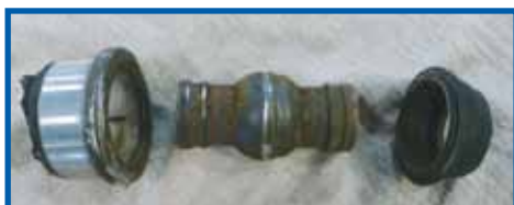
Porte-pivot à axe transversal démonté