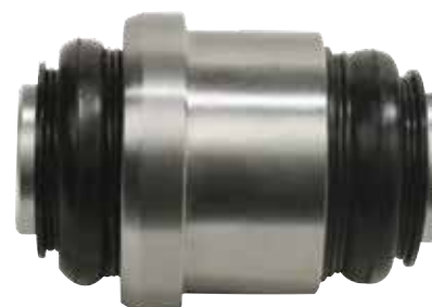
Porte-pivot supérieur MOOG K200174