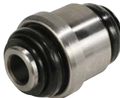
Porte-pivot inférieur MOOG K200175